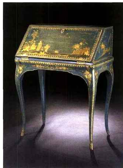
Secrétaire en pente, Dresde, vers 1738 Peinture probablement due à Christian Reinow H 99 cm, L 79 cm, P 49 cm Robbig (Munich)

La 2 e édition de la Salzburg World Fine Art Fair se tiendra du 9 au 17 août dans la Residenz, ancien palais des princes-archevêques de Salzbourg. Une trentaine d'exposants est attendue, parmi lesquels de nombreux Allemands et Autrichiens, tel Bernheimer, et le Français Steinritz Generaliste, la foire expose tant du mobilier et des objets d'art que des tableaux anciens ou modernes, de l'argenterie, des bijoux et de la joaillerie. On pourra par exemple acquérir, sur le stand de Robbig (Munich), un secrétaire en pente peint en bleu et orné de