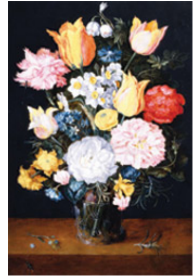
Illustration : Jan Breughel le Jeune, Bouquet de fleurs , huile sur cuivre 30,5 x 27 cm, galerie Bernheimer