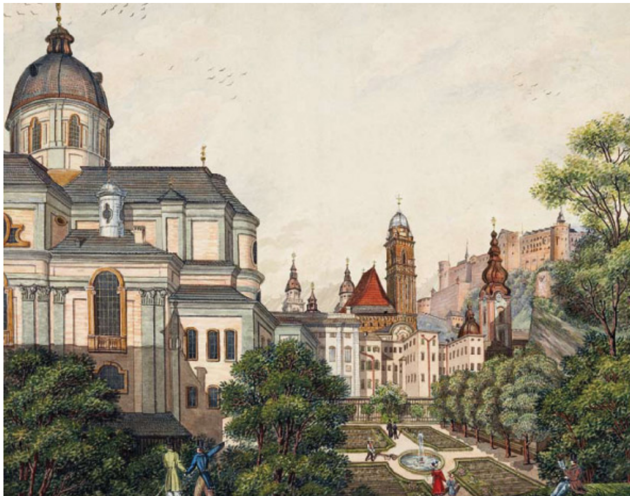
Salzburg Kollengien Kirche

Dans un cadre baroque, la deuxième édition d'une foire de qualité réunissant une trentaine de marchands internationaux d'art, d'antiquités et de joaillerie.