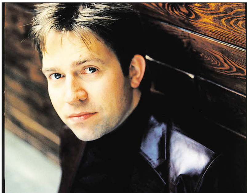
Schubert im Spiegel anderer: der Pianist Leif Ove Andsnes.

Die Folge dieses ungemein intelligent programmierten Abends: Jubel, drei Zugaben – und beim Heraustreten ins Freie erfrischend kühle Gewitterluft.