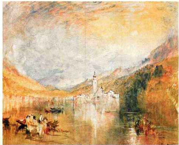
Turner, Küssnacht, Lac de Lucerne, 1842-1843 . Collection de la Tate Gallery, Londres.

Saul Steinberg : illuminations Kunsthau 22 août → 2 nov.