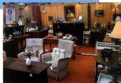
■ Ciney, l'une des plus grandes foires de Belgique.

● Du 19 au 21 juillet, à Ciney Expo. Internet: www.cineyexpo.be