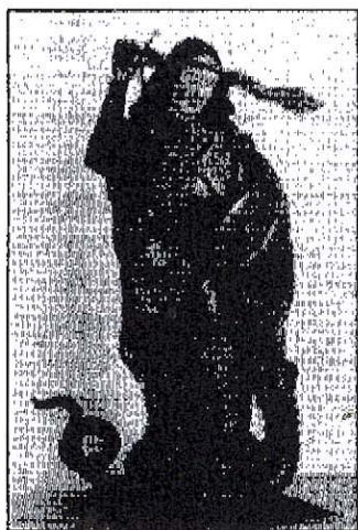
Szent Mihály szobor (1490 körül) Tirol, az Oberschwäbische Barockgalerie standján